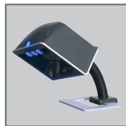
Support flexible MLPN 46-00868