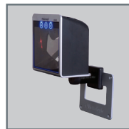
Support mural MLPN 46-00869