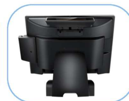
Nombreux accessoires disponibles