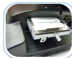
Entretien rapide et facile