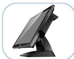
Ecran 15 pouces Bezel Free